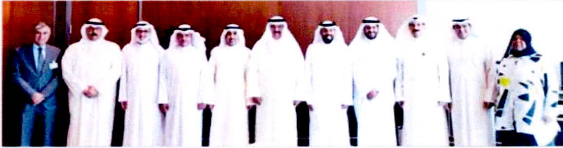
وفد رابطة "التطبيقي" وقياديو الهيئة